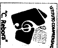
TABELLA DI VALUTAZIONE TUTOR